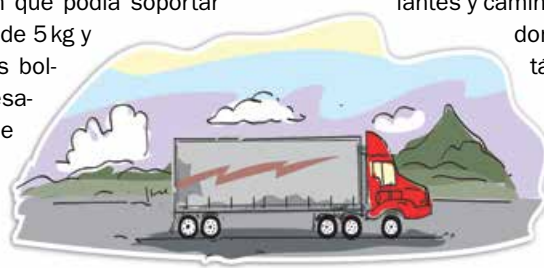
Ilustraciones: Carlos Durand