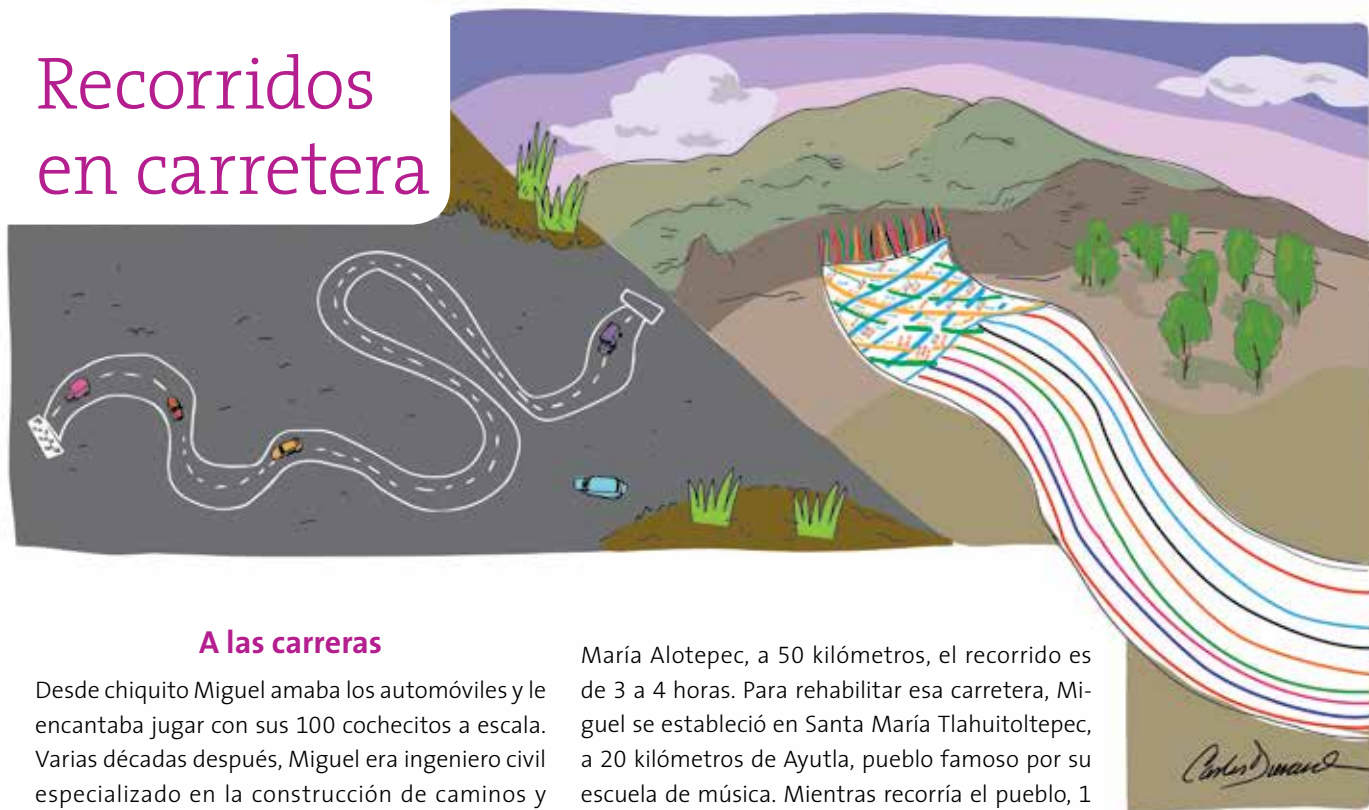
Ilustración Carlos Durand