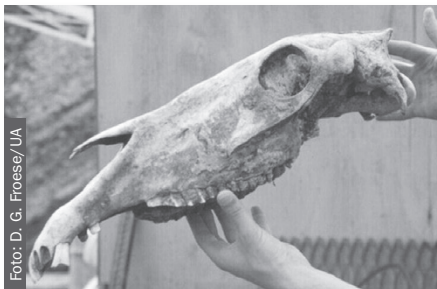
Cráneo de Equus lambei , caballo extinto del Pleistoceno tardío, Yukón, Canadá.

Desde hace unos 20 años, en la secuenciación genética se usa ADN mitocondrial porque es mucho más abundante que el ADN nuclear: una célula posee cientos de mitocondrias, pero un solo núcleo. La técnica empleada, conocida como PCR, o reacción en cadena de la polimerasa, supone la selección a priori de una región específica del genoma del organismo que se secuencia. Sin embargo, desde 2005 se utilizan nuevas técnicas de ultra secuenciación, llamadas de